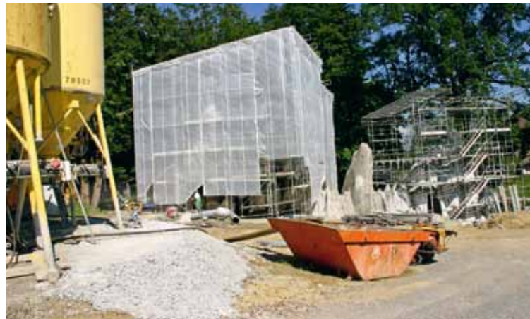
Der bulgarische Künstler Christo hätte die Felsen nicht besser einpacken können.