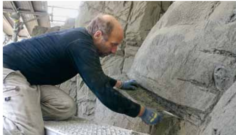
Bildhauer bearbeiten die noch feuchte Spritzbetonschicht, um dem Kletterfelsen die unverkennbare Felsenstruktur zu verleihen.

gehend die Feinstruktur verloren. Nun waren die Bildhauer gefragt. Aus frisch aufgetragenen Spritzbetonschichten schabten, kratzten und ritzen die Künstler die Feinstrukturen aus dem noch feuchten Beton. Stück für Stück erhielt der Felsen wieder das alte Kleid aus neuem, aussen aufgetragenem Material. Mit genauen Plastilinmodellen hatten die Bildhauer zuvor die alten Felsstrukturen nachgebildet, um den neuen Felshüllen wieder die alten Strukturen zu verpassen.