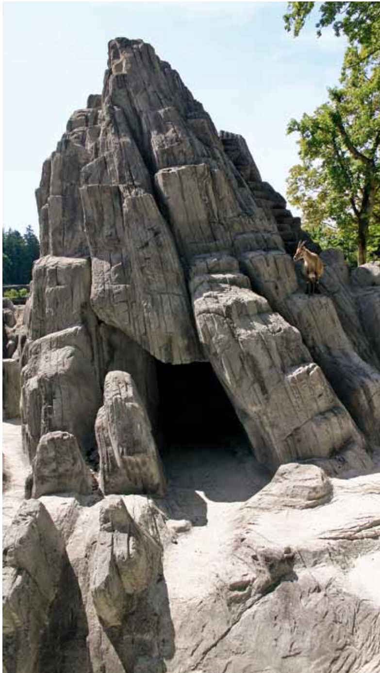
Neu ist ein gitterfreier Einblick in die Felsenanlage.