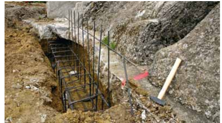
Eisenarmierte Streifenfundamente tragen von nun an die Last der Felsen.