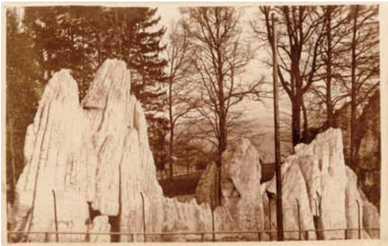
1912 wurden die Felsen im Westen des Parks erstellt.

1912 Für die Gämsen wird ein weiterer Felskomplex gebaut, die zwei Felsen am Eingang des Parks. Statt 4 Wochen Bauzeit sind mehr als 16 Wochen nötig. Der Voranschlag von 7 000 Franken steht den tatsächlichen Kosten von 14 000 Franken gegenüber.