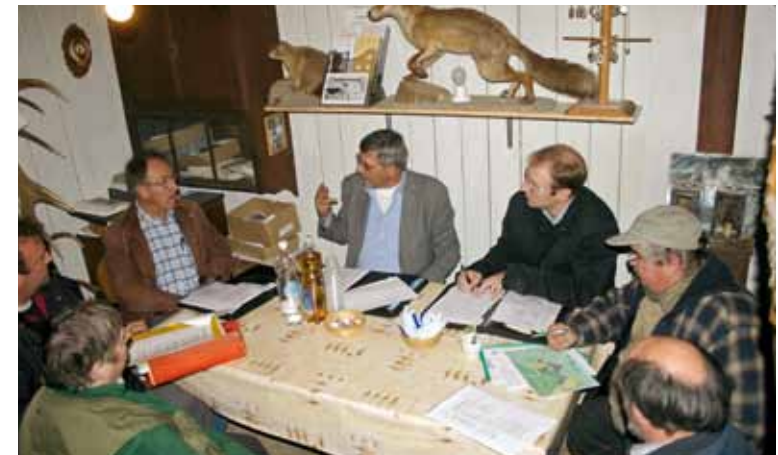
In mehr als 50 Bausitzungen planten und koordinierten die Mitglieder der Baukommission die anspruchsvollen Arbeiten.