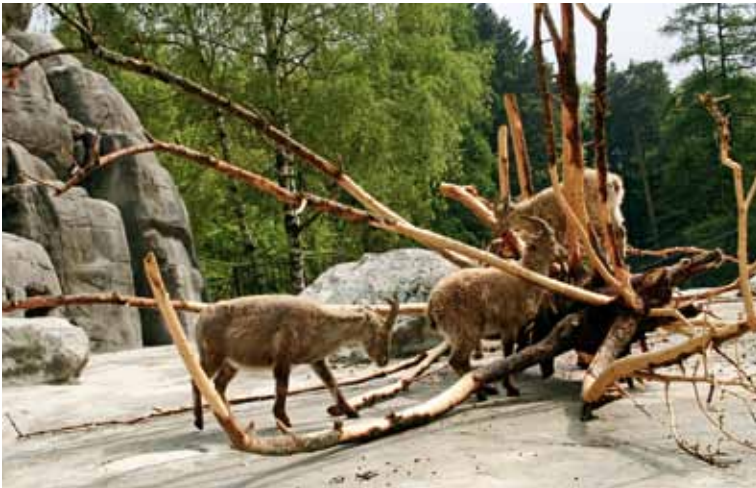
Am Baumstamm lässt sich herrlich kratzen und die Rinde schmeckt köstlich.