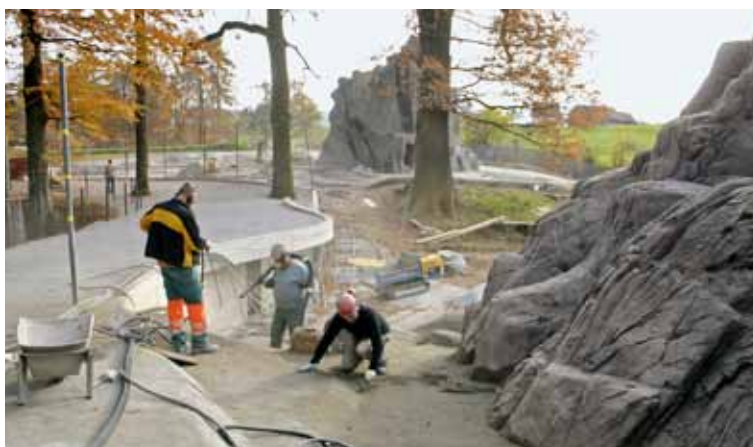
Spritzbetonarbeiten in der Umgebung der Felsen. Im Hintergrund die K + D-Passerelle, eine Zuschauerplattform.

Die Felsen sind neu in Strukturen eingebettet, die dem Gehege eine noch grössere Authentizität geben. Steinblöcke, Stufen, Rampen modellieren die Felsumgebung. Schatten spendende Bäume wurden gepflanzt. Es entstanden abwechslungsreiche Gehegestrukturen. Der Hartbelag ist ein Erfor-