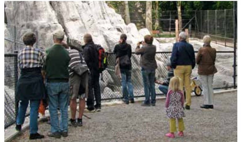
Zuschauer beobachten eine Geburt in der neuen Felsenanlage.