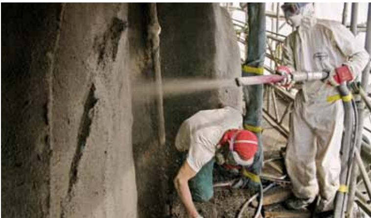
Auftrag der Spritzbetonschicht in Schutzkleidung.

Das Modellieren der Felsen war eine komplexe, zeitintensive und äusserst anspruchsvolle Arbeit. Die alten Felsen wurden gewissermassen als «verlorene Form» benutzt. Auf die gereinigten Felsen wurde eine doppelte Trennschicht aus Kunststoffmasse aufgespritzt. Mit dieser Trennschicht wird vermieden, dass der alte Chemismus des historischen Felsmaterials mit dem neu aufgetragenen Material in Kontakt treten kann. Auf diese Trennschicht spritzte man eine erste Betonschutzschicht auf. Weitere Spritzbetonschichten folgten. In diesen Schichten steckt die Armierung, feine, bis fünf Zentimeter lange Stahlnadeln, die dem Spritzgut beigemischt wurden. Nach dem Auftrag der diversen Schichten hatten die Felsen weit-