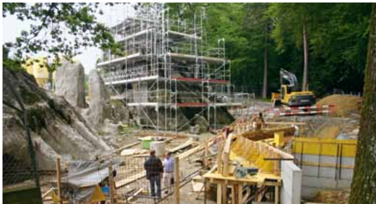
Die K + D-Passerelle im Bau.

Die Vorgaben für die umfassende Felsensanierungen waren ambitiös: Der Charakter des Wildparks und die einmaligen, mehr als 100-jährigen Kunstfelsen sollten erhalten bleiben. Für die Tiere sollten grössere, attraktivere Gehege, für die Zuschauer bessere Einblicke in die Gehege und für die Parkwärter einfachere Betriebsabläufe möglich werden. Der Park sollte während all der Zeit für die Besucherinnen und Besucher offen bleiben und die Tiere sollten weiter hier gut leben können. Zudem galt es, die Mittel für die veranschlagten Baukosten in der Höhe von rund 5 Millionen Franken aufzutreiben, denn erst wenn die Finanzierung sichergestellt war, durfte mit der Sanierung begonnen werden. Das Resultat darf sich sehen lassen, ohne falsche Bescheidenheit kann gesagt werden: gelungen!