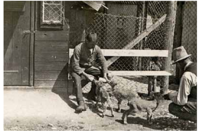
Die Aufzucht der Kitze mit der Schoppenflasche um 1910.

1907 Urs Eggenschwiler kann einen zweiten Felsen bauen, den «grossen Felsen» neben dem Dianaplatz. 8 000 Franken sind veranschlagt worden. 14 213 Franken kostete schlussendlich das Bauwerk. Der Wildpark musste bei der Ortsgemeinde St. Gallen ein Darlehen von 10 000 Franken aufnehmen!