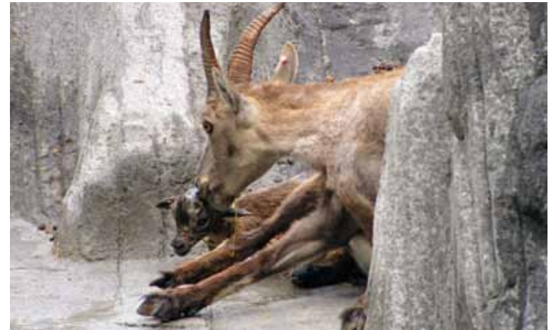
Nach der Geburt leckt die Geiss ihr Kitz trocken.