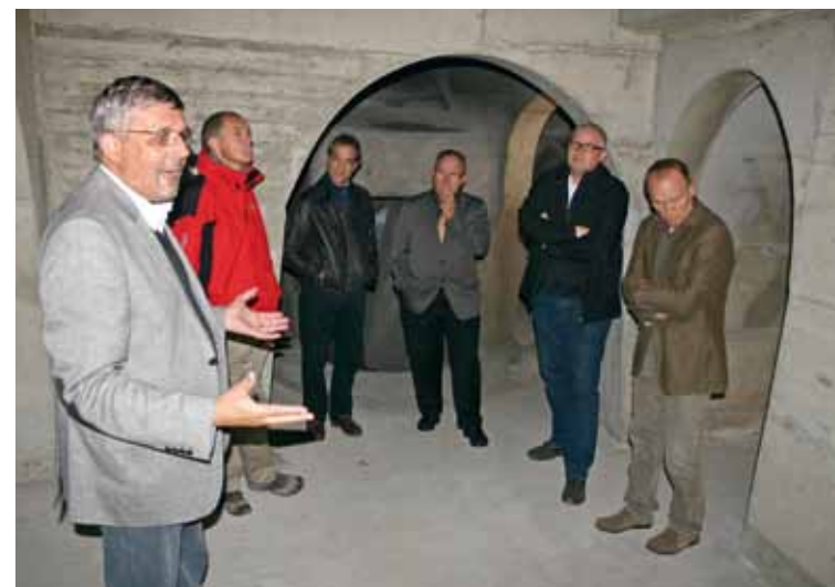
Neues Innenleben der Felsen: Beton statt Holz.

2011 Am 22. Juni, genau 105 Jahre nach dem Eintreffen der ersten drei Steinkitze, erfolgte die feierliche Einweihung der erneuerten Felsenanlage mit Vertretern der Gönner und Geldgeber.